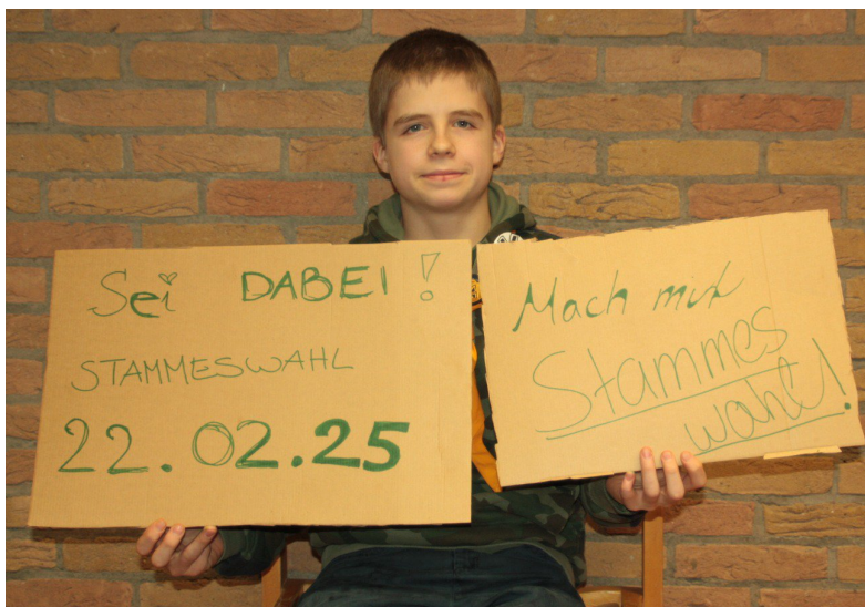
Stamm Asgard Erlangen im Bund der Pfadfinderinnen und Pfadfinder e.V.